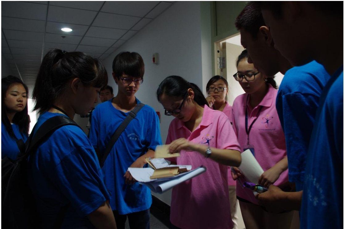
志愿者们为营员提供细致周到的服务