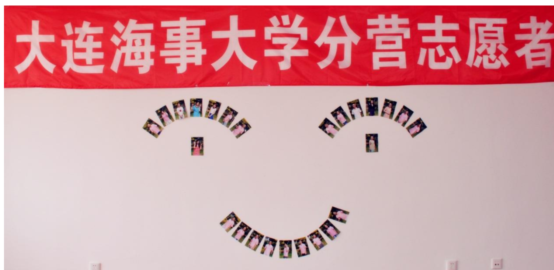
25 位随队志愿者用微笑迎接科学营师生的到来