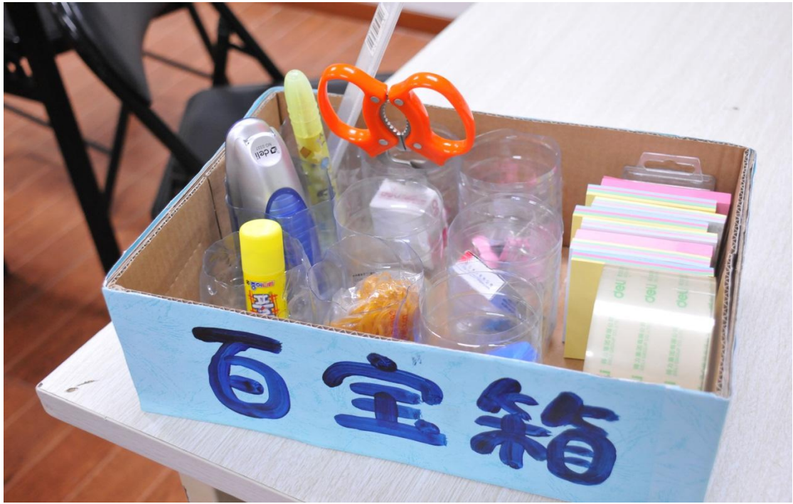
细微之处展现贴心关怀