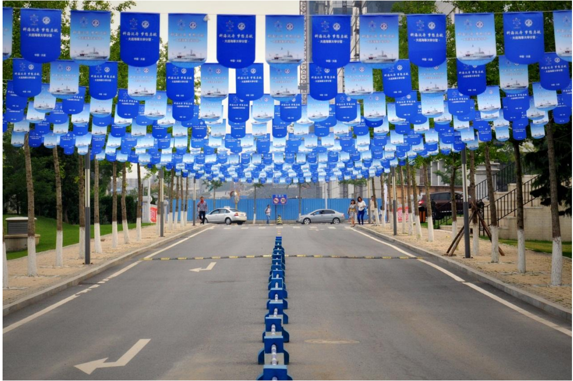
有海大特色的校园氛围迎接营员的到来