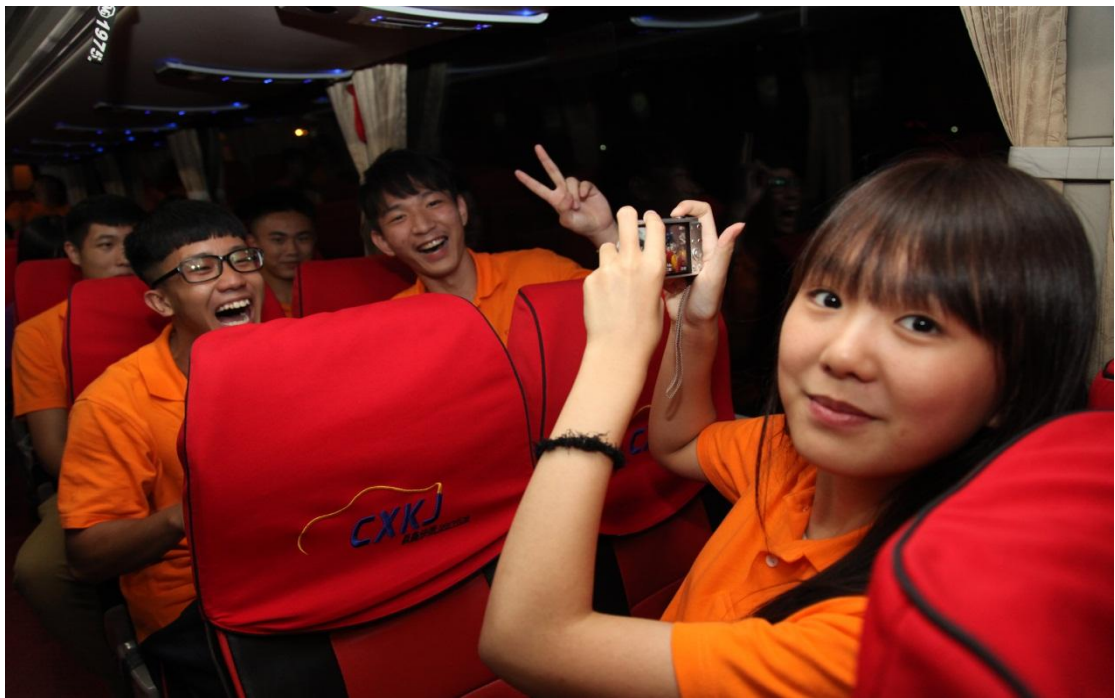
初到大连的惊喜掩盖了旅途的疲惫